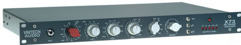
The Vintech Audio X73